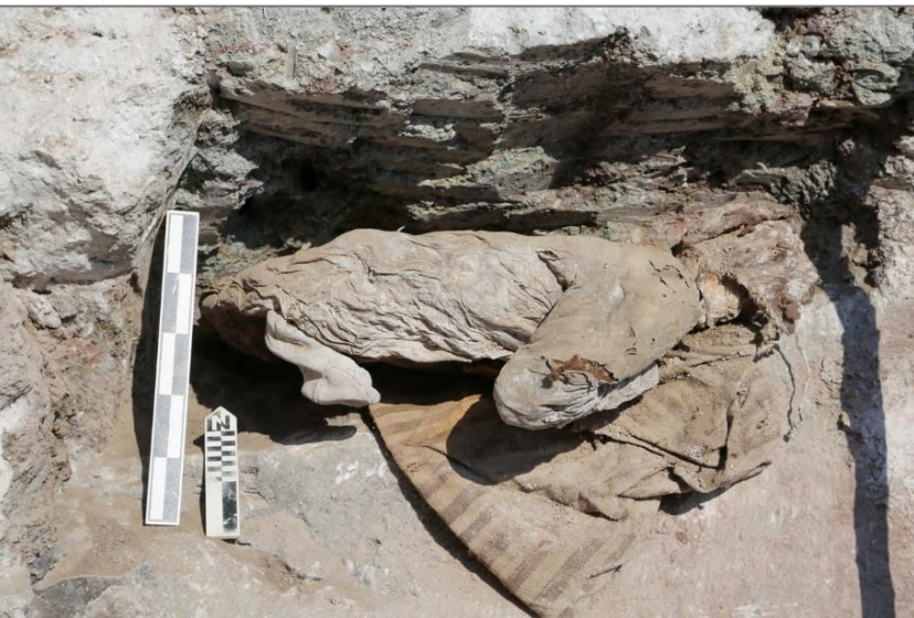
シュグデンノール発見のミイラ