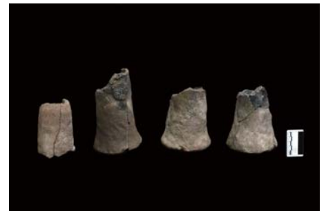
ホスティン・ボラグ遺跡の調査（製鉄炉・炉壁・羽口）