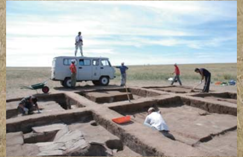
モンゴルでの調査風景（フレル・ウネグ2A遺跡、ホスティン・ボラグ遺跡、アウラガ遺跡）