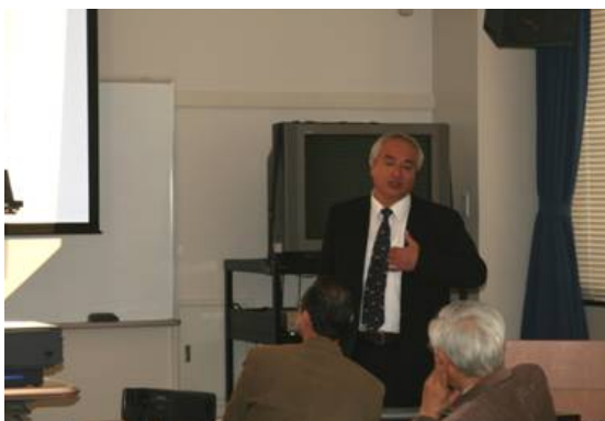
遅澤先生による講演