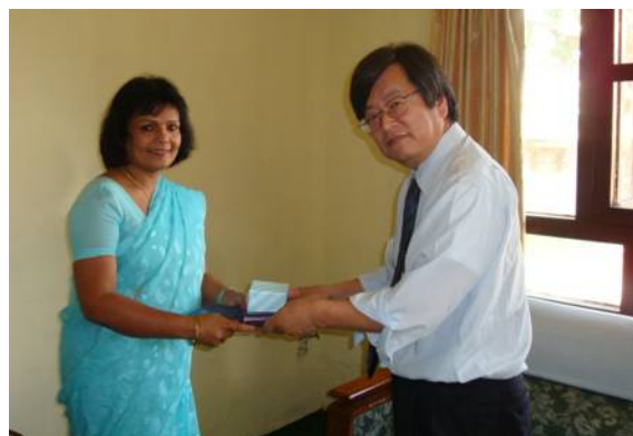
文部大臣と矢田部先生