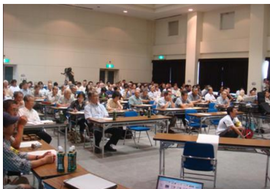
宇和島市地震体験談市民フォーラム