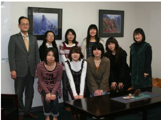
紙芝居制作協力者 (愛媛大学美術研究会)