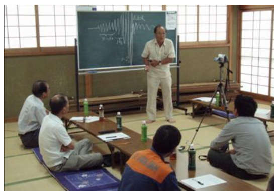
会での体験談を聞く様子