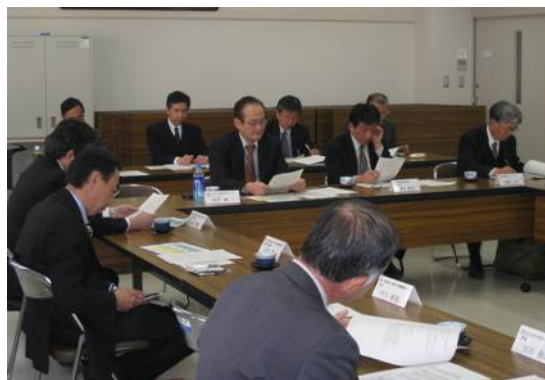
建設 BCP 懇談会愛媛県部会の様子