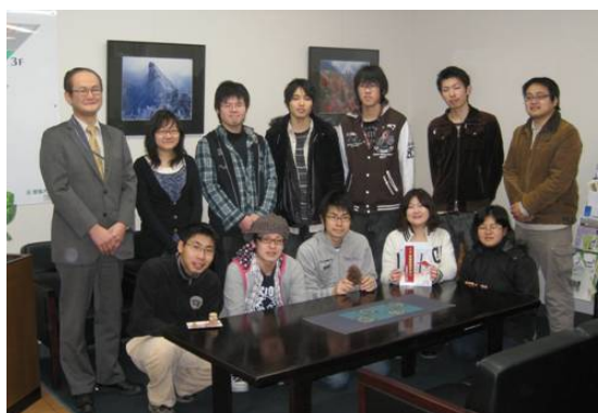
愛媛大学漫画研究会（左端：鳥居先生）

当学漫画研究会の協力を得て、10 話の漫画化を行ない、「四国防災ばなし」として出版するとともに、当センターのホームページで公開しました。