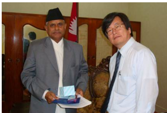
大統領と矢田部先生