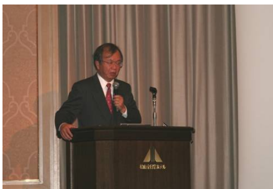
河田先生による講演

河田先生からは、「地域継続のためには、まずは社会基盤がきちんと整備されている必要がある。特に 8 の字型に高速道路を整備する必要がある。道路の整備が遅れていると復旧・復興が遅れる。復興の広域連携が重要である。被害を受けなかった地域との協定・連携が必要である。復興計画を事前に考えておく。復興は地域の経済再建を考慮したペースで進めることが重要。」とのコメントをいただきました。