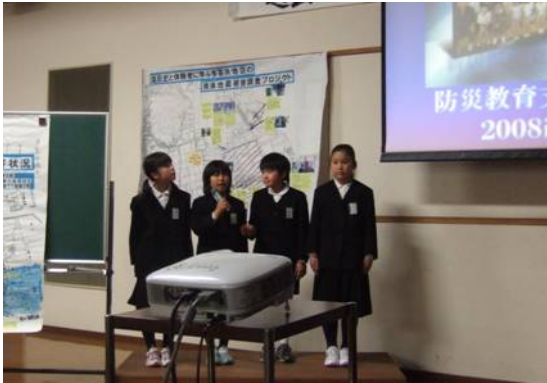
防災教育事例発表会での 小学生による報告