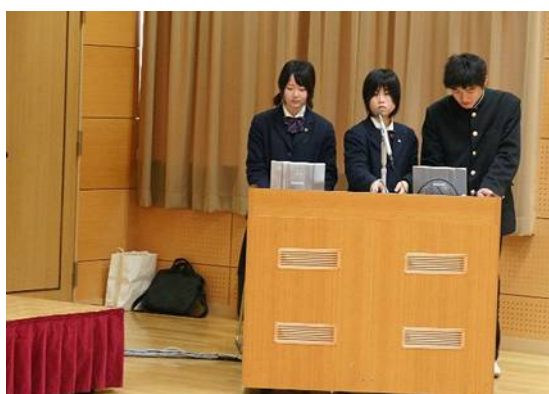
高校生による発表