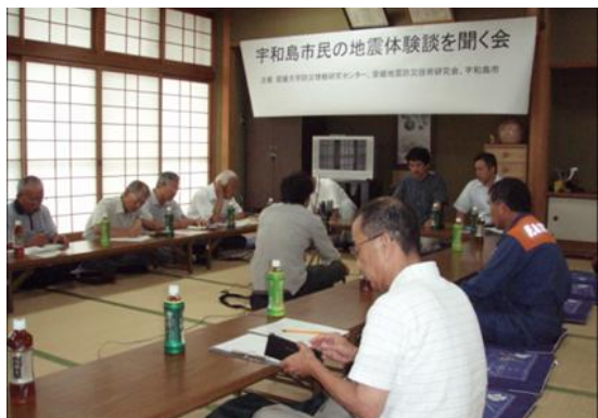
宇和島市民の地震体験談を聞く会

体験談を聞いた後でのパネルディスカッションでは、地震体験談を後世に語り伝えて行くことの重要性と、これらを活用した防災活動の取り組みの必要性が口々から出てきました。