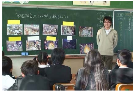
小学校での授業風景