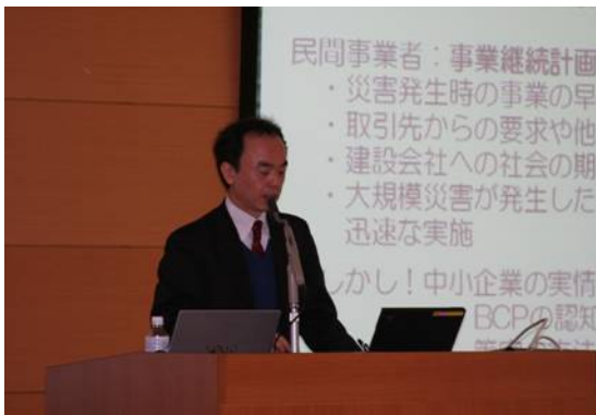
東根環境防災部長による講習

講習会後のアンケートでは、企業防災に対する考え方が「非常に変化した」が25%、「少し変化した」が67%となり、一定の効果があつたと判断されます。