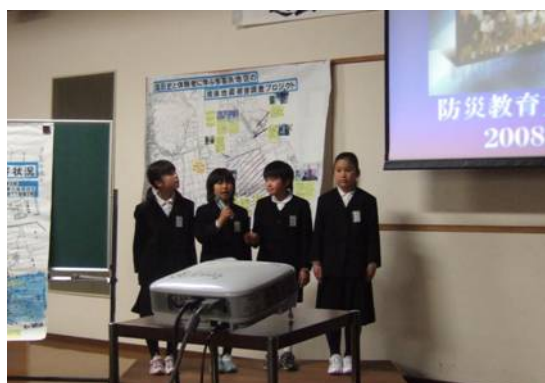
小学生による発表