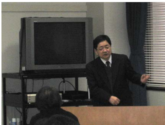
正木社長による講演

出席者：10名（カリフォルニア州立 Polytechnic Univ., Pomona 一色名誉教授、民間会社3名を含む）