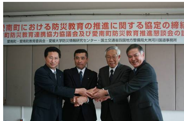
愛南町との調印式