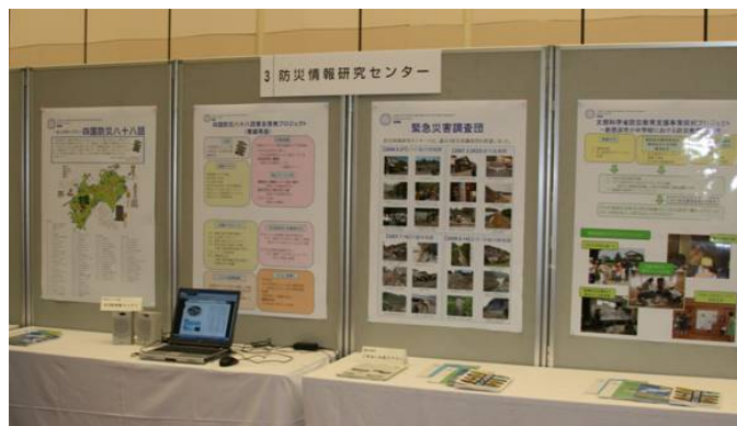
防災情報研究センターのブース

平成 20 年 8 月 28、29 日にひめぎんホール真珠の間で開催された「あいだい博 2008」に防災情報研究センターとして出展しました。センターを紹介するパネルとともに、センターが過去に派遣した災害調査団の記録や四国防災八十八話を紹介するパネルを展示しました。また、四国防災八十八話の Web 版のプロトタイプを公開しました。