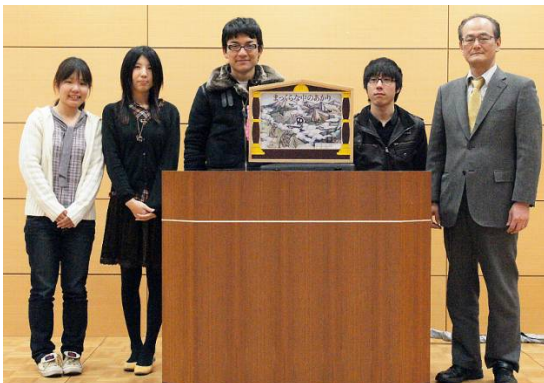
重信川エコリーダー