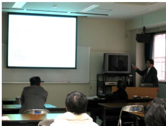
山岸先生による講演