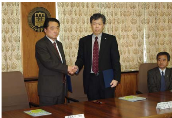
西日本高速(株)四国支社との調印式