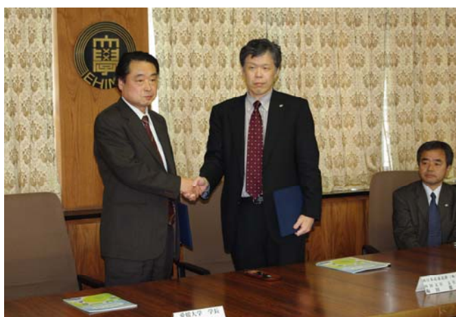
調印後かたく握手をする梅田支社長と小松学長

なお、本協定に先立って、平成 20 年 5 月に愛媛大学側から研究シーズの紹介、また 7 月には、西日本高速道路(株)側から研究ニーズの紹介があり、これらの会合については全学に周知し、防災情報研究センター教員以外にも工学部や農学部の教員が参加しました。共同研究としては平成 21 年度に、「地下水による盛土のり面の安定性に関する研究」が予定されています。