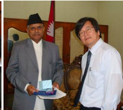
ヤダブ大統領と矢田部部門長