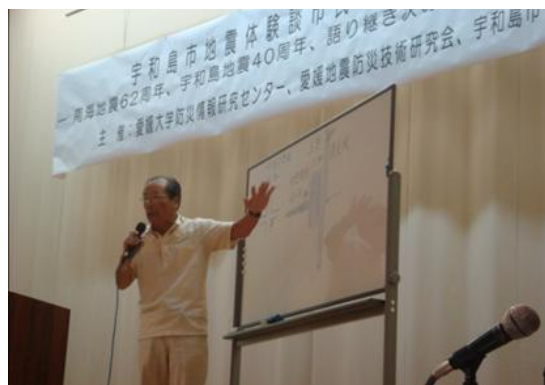
フォーラムでの体験談の講演