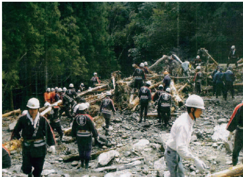
▲消防団による復旧作業

現場に着くと水は深いところでは、すでに胸の高さまで達しています。施設の入所者は恐怖で一様に青ざめて震えています。その人たち一人一人を背負っての危険な避難です。洪水の流れの中での避難は本当に怖く、泣き出す人が何人もいました。このような状況の中で施設の入所者に一人の犠牲者も出なかったのは奇跡としか言いようがありません。これはみんなが心を一つにして、困難に立ち向かったからだと思っています。