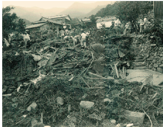
▲ 捜索活動の状況 ▶