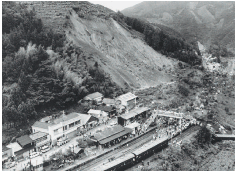
▲昭和47年の繁藤災害